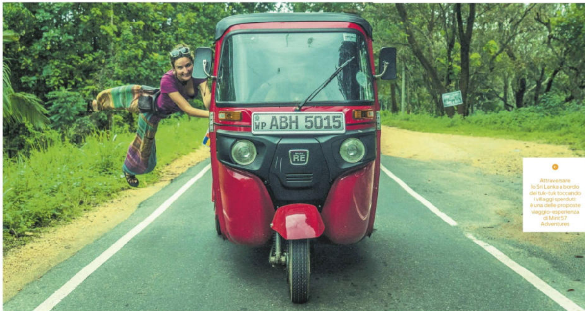
Attraversare lo Sri Lanka a bordo del tuk-tuk toccando i villaggi sperduti: è una delle proposte viaggio-esperienza di Mint 57 Adventures