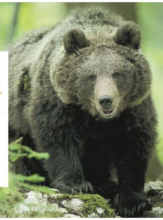
Tra le foreste meridionali della Slovenia sono garantiti incontri ravvicinati con gli orsi