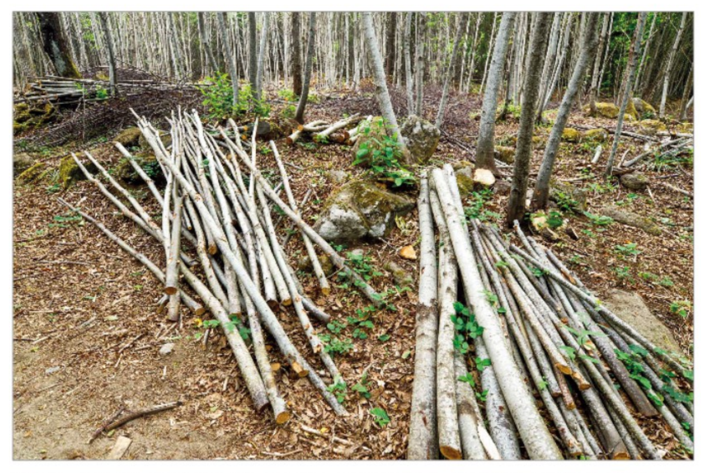
Foto 2 - Il prodotto tradizionale dei cedui di castagno del monte Amiata è la paleria. La produzione di paleria di castagno non solo è funzionale alla conservazione del paesaggio tradizionale del Monte Amiata ma anche al mantenimento di altri paesaggi tradizionali toscani, come ad esempio i vigneti del Chianti che utilizzano questo prodotto.

(sensu CEP - CU) non solo "è compatibile" ma "necessita" della continuazione delle attività agricole e forestali tradizionali in quanto è l'abbandono colturale a comportare la rapida "perdita del paesaggio tradizionale".