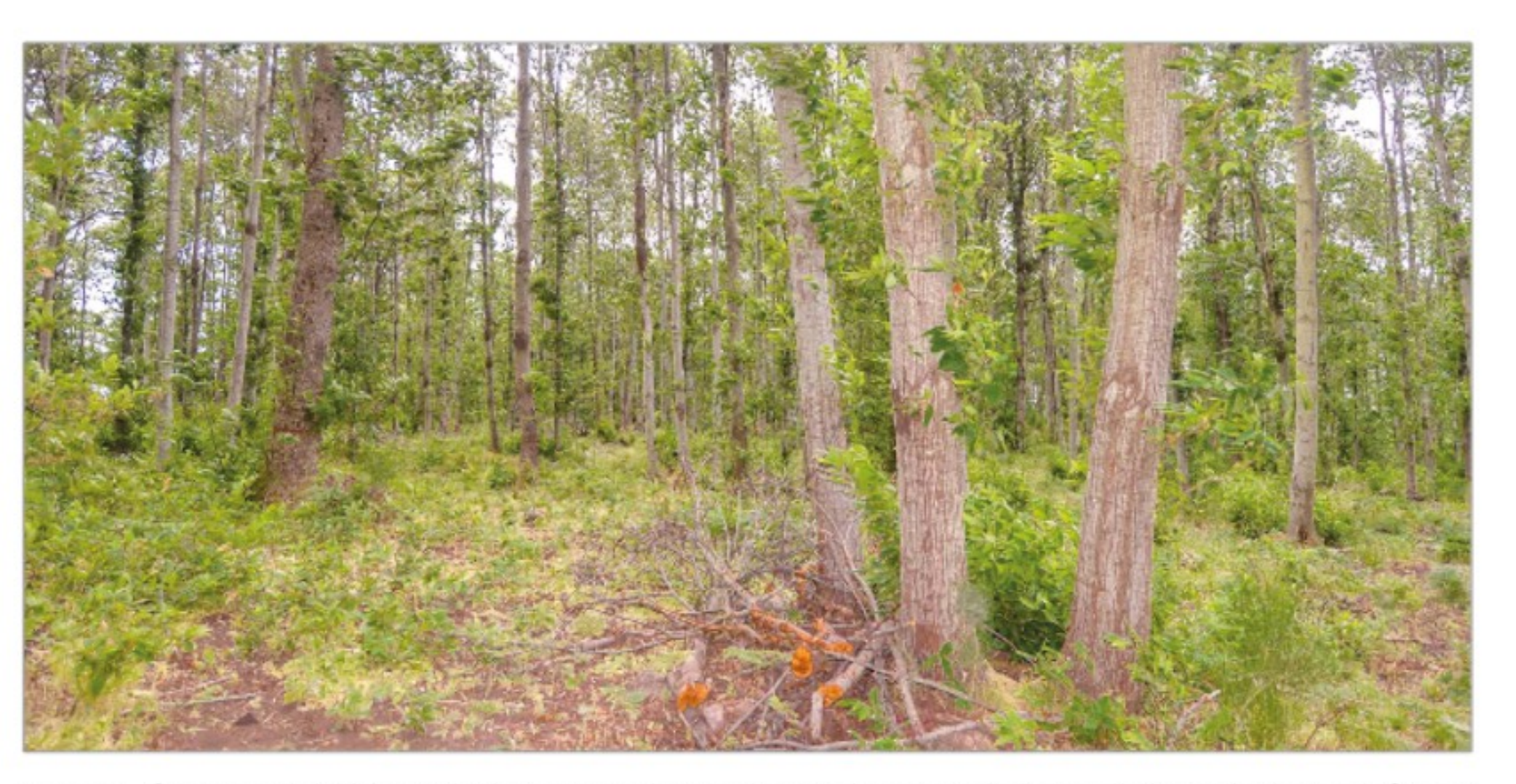
Foto 3 - Castagneti del Monte Amiata a turno lungo che producono pali di grandi dimensioni e travi. Questi boschi a maturità hanno una densità ed una struttura simile a quella dei boschi d'alto fusto.