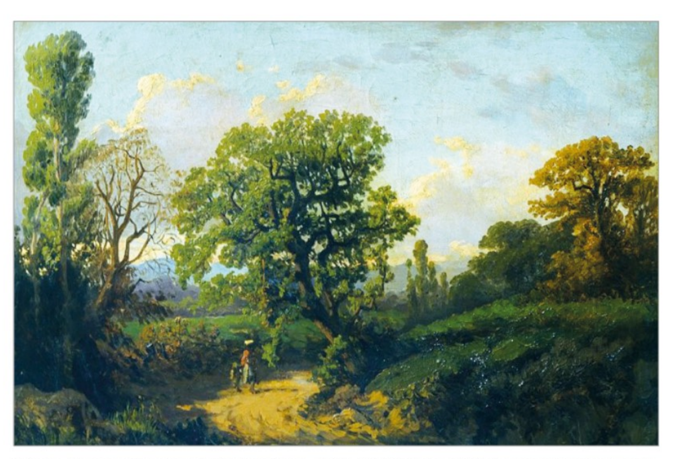
Foto 1 - Il bosco nel paesaggio storico toscano dipinto dai pittori macchiaioli è sempre un bosco aperto, alternato a campi, prati e con la presenza costante dell'elemento umano (SERARINO DE TIVOLI, Paesaggio "seconda maniera", collezione privata - <u>www.pandolfini.it/it/asta-0275/serafino-de-tivoli.asp</u>).

saggio culturale" è ampiamente descritto e ammirato. È il paesaggio per cui l'Italia è famosa nel mondo, al pari dei suoi monumenti e delle sue città d'arte, e che produce valori economici grazie ad attività quali il turismo rurale e l'agriturismo. Già nel periodo romano erano rare le foreste ancora considerabili come "primeve". E se da un lato la conservazione della biodiversità e la mitigazione della crisi climatica richiedono senz'altro una gestione forestale responsabile e attenta a questi aspetti, dall'altro l'idea astratta di "ritorno alla natura", su cui si appoggiano alcune delle attuali correnti di pensiero ambientalista, ma che ha preso corpo già dalla fine dell'800, è stata artificiosamente sovrapposta alla matrice culturale del paesaggio italiano. Contrariamente ai luoghi comuni, l'interazione dell'uomo con il sistema naturale ha addirittura contribuito a creare anche aree ad elevata biodiversità, oggi tutelate dalla Rete Natura 2000 (FARINA 2000). Certamente, conciliare le esigenze del paesaggio, della biodiversità, del clima e della produzione di beni non è sempre facile, anche perché in Italia esiste un mosaico di competenze che richiede una delicata azione di coordinamento (SITZIA 2020). Infatti, mentre la competenza primaria relativa al paesaggio spetta al Ministero per i Beni e le Attività Culturali e per il Turismo (e quindi alle Soprintendenze), le normative e le politiche ambientali di conservazione della