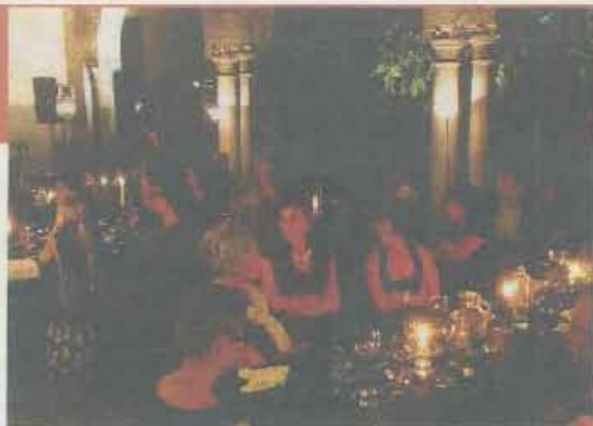
● La cena si ispira al romanzo di Huysmans «À rebours»