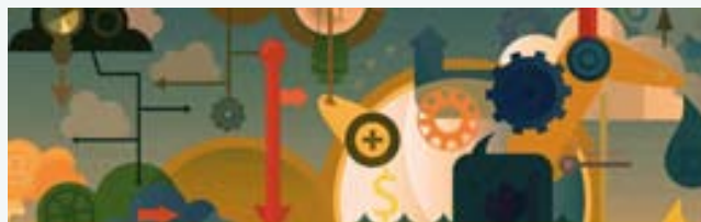
Creatività e design dei servizi