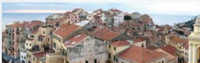
Riqualificazione del costruito

DNA.italia ha individuato 6 aree tematiche per rendere più comprensibile e completo il racconto della filiera. All'interno di ogni area DNA.italia lavorerà in stretta sinergia con partner di alto profilo per approfondire le tematiche più attuali di ciascun segmento di mercato.