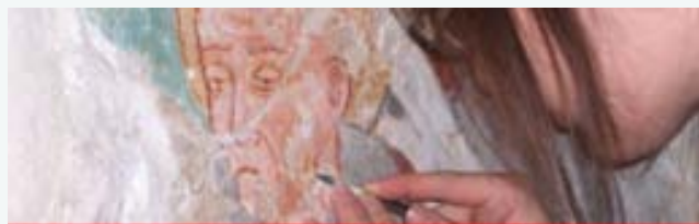
Restauro e conservazione