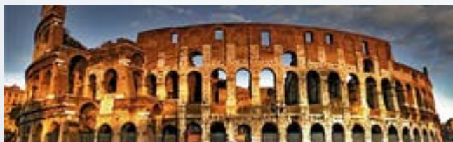
Turismo e attività culturali