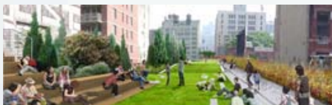
Paesaggio naturale e urbano