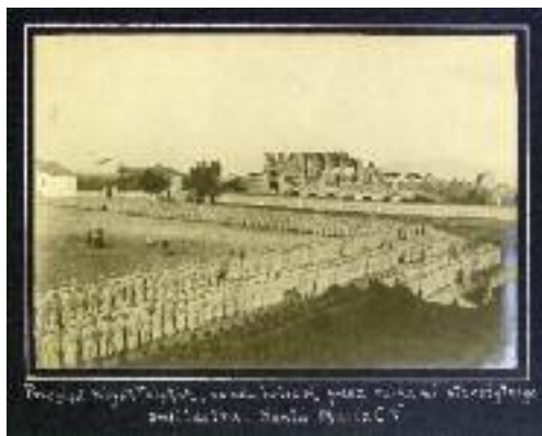
Rassegna dei reparti al campo di Santa Maria Capua Vetere

Su pressione dei delegati romani del "KNP" e dei governi alleati, le autorità italiane accettarono di raggruppare i prigionieri po-