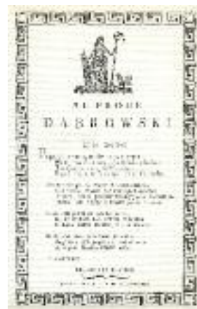
Luigi Cagnoli, Al prode Dąbrowski , Reggio Emilia 1797.

Stampato. Riproduzione da: U. Bellocchi, Avanti, avanti Dąbrowski! Con te dall'Italia torneremo in Polonia , Reggio Emilia 1997.