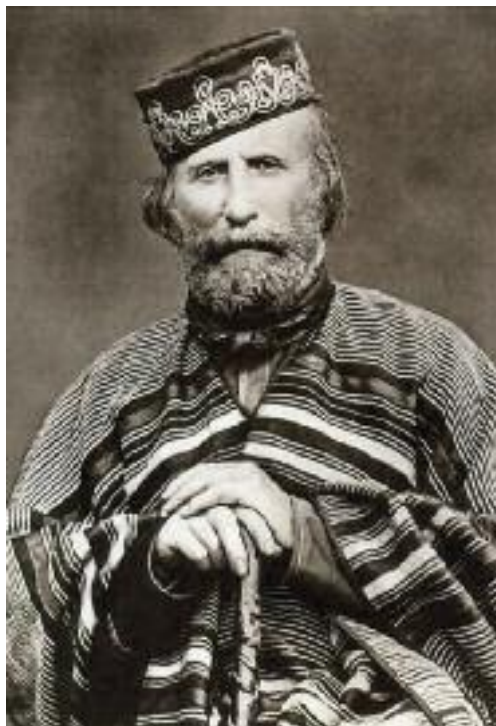
Giuseppe Garibaldi