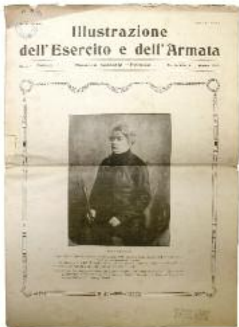
Sopra: «Illustrazione dell'Esercito e dell'Armata», Numero Speciale "Polonia", Marzo 1919

Biblioteca Begey, Biblioteca del Dipartimento di scienze del linguaggio e letterature moderne e comparate, Università di Torino.