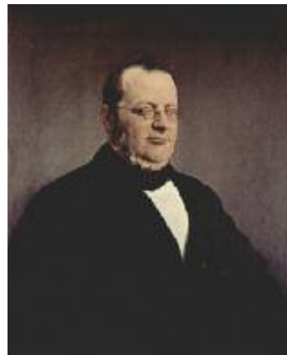
Camillo Benso conte di Cavour.