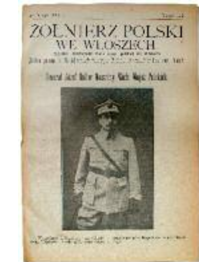
"Żołnierz Polski we Włoszech", n. 3, 20 febbraio 1919.

Mediamente composto di otto pagine in ottava, con rare illustrazioni, veniva distribuito tra i soldati del campo, e alcuni esem-