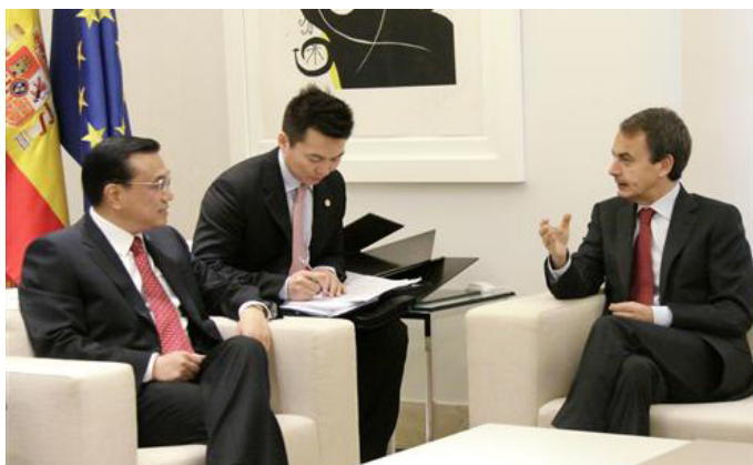
Il Vice Primo Ministro della Rpc Li Keqiang con il Primo Ministro spagnolo Zapatero.

Al di fuori della sfera economica, il 2010 ha messo in luce il perdurare delle tendenze centrifughe e delle debolezze strutturali che limitano la capacità dell'Ue di gestire con efficacia le relazioni con Pechino. Sul versante dello hard power , l'Unione è sprovvista di uno strumento militare capace di significativa proiezione di forza, mentre i bilanci della difesa di alcuni dei principali paesi membri hanno subito drastiche contrazioni a causa dei crescenti vincoli cui sono sottoposte le finanze pubbliche. La Rpc prosegue, invece, nell'ammodernamento delle proprie dotazioni e, secondo i dati Sipri , si conferma il secondo paese al mondo dopo gli Stati Uniti quanto a bilancio della difesa.