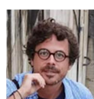
Francesco Beccuti Didattica della matematica