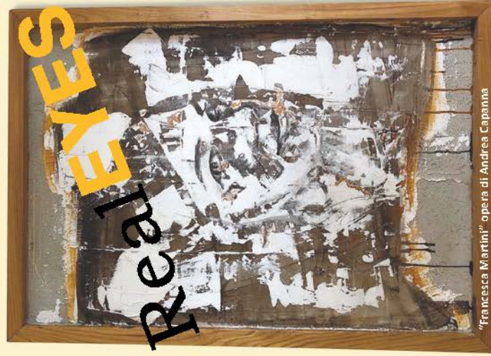
"Francesca Martini" opera di Andrea Capanna