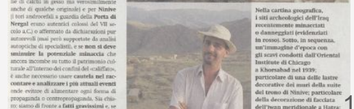
Nella cartina geografica, i siti archeologici dell'Iraq recentemente minacciati o danneggiati (e distrutti) in rosso. Sotto, in sequenza, un'immagine d'epoca con gli scavi condotti dall'Oriental Institute di Chicago a Khorsabad nel 1939; partecipante di una delle lastre decorative dei muri della suite del trono di Ninive; partecipante della decorazione di facciata dell'ipso mercuriale a Hatra;