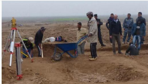
«È interesse degli abitanti del villaggio proteggere gli archeologi, così hanno il lavoro assicurato»