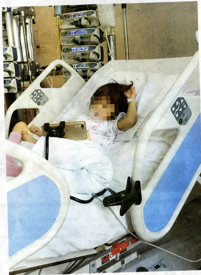
La piccola, 3 anni, è già in fase di ripresa

Il decorso postoperatorio è buono, la parte di fegato trapiantata lavora bene