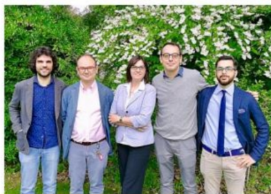
IL TEAM NEMOSANCTI Il progetto studia l'idea di santità attraverso più discipline

miseria e la malattia, non solo assistendo i bisognosi, ma fornendo un aiuto più strutturato, dando opportunità di risollevarsi e trovare un posto migliore nel mondo».