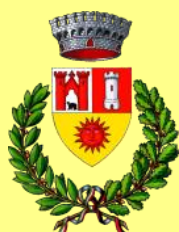
Comune di Valpelline