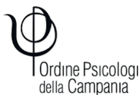
Ordine degli Psicologi della Campania