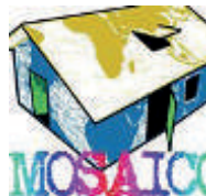
Associazione Mosaico - Torino