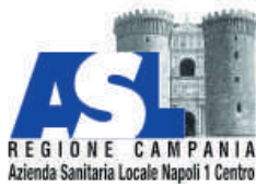
Asl NA1 - Napoli