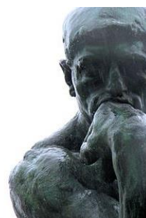
IL PENSATORE, AUGUSTE RODIN

24 - Introduzione alla Filosofia del Novecento. Giovanni Bosco