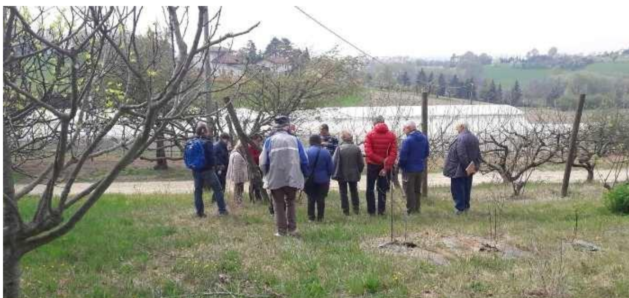
LABORATORIO DI MANUTENZIONE DEL GIARDINO AL BONAFOUS, LEZIONE SULLE POTATURE

Quattro incontri di tre ore ciascuna condotte da ENGIM PIEMONTE - Bonafous Chieri. Periodo: ottobre–novembre o febbraio–marzo (indicativamente una lezione ogni 15 giorni) Sede: ENGIM, Istituto Bonafous, Strada Pecetto 34, Chieri