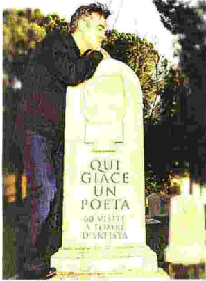
• Qui giace un poeta

• Il calendario insolito La nostra storia giorno per giorno, dall'antichità fino a "ieri", al XX secolo