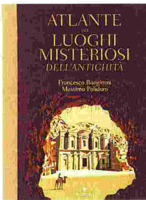
• Atlante dei luoghi misteriosi...