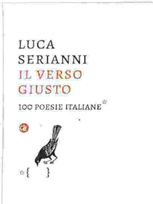
• Il verso giusto