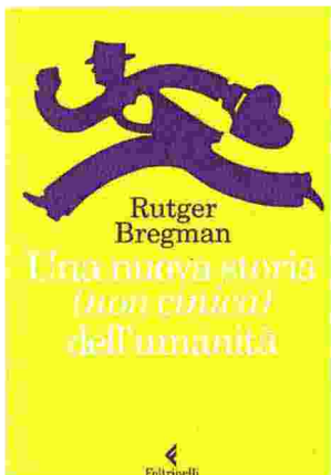
• Una nuova storia (non cinica)...